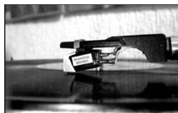
– Snakk med plateselskapene