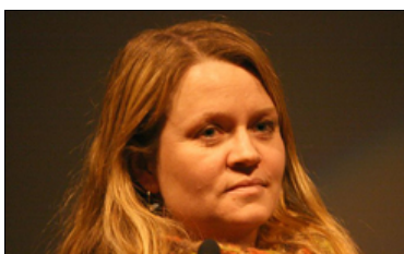
NRK og IFPI i forhandlinger